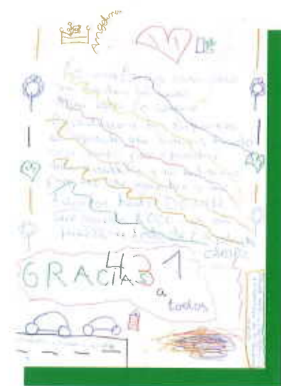
Carta de una niña de 7 años. Angelina.