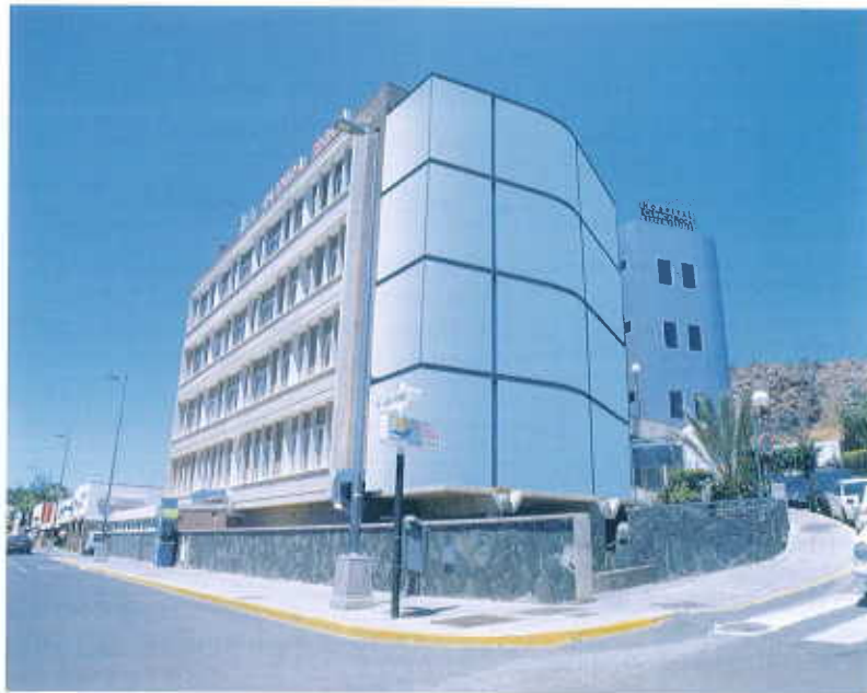
Hospital Clínica Roca, Gran Canaria.