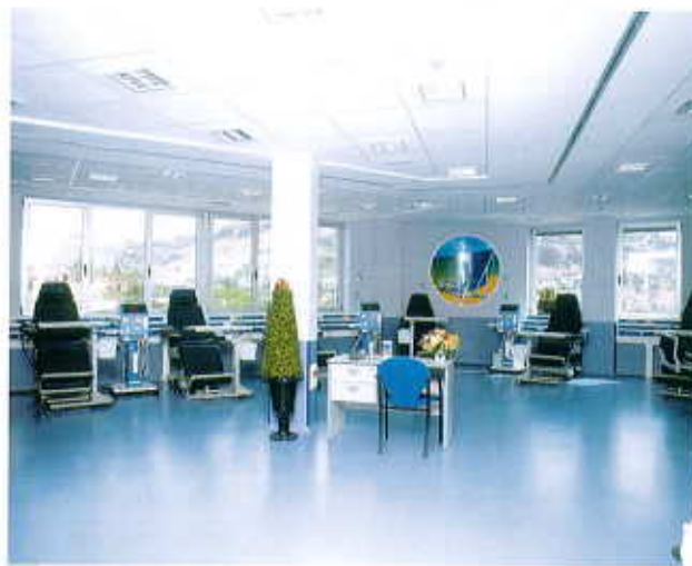
Diálisis del Hospital Clínica Roca, Gran Canaria.

Hospital Clínica Roca, único de carácter privado en el sur de Gran Canaria, ofrece a todos los residentes de la zona la comodidad de poder contar con unos servicios asistenciales de la máxima calidad cerca de su hogar, recibiendo el trato humano y cordial que se merecen.