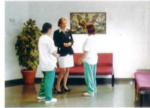
HOSPITEN Bellevue, Tenerife

El compromiso con las políticas de Aseguramiento de la Calidad ha incidido en la mejora de los servicios prestados por HOSPITEN a sus clientes y se ha traducido en la concesión, por parte de la Asociación Española de Normalización y Certificación (AENOR) en 1998, del certificado que acredita que los Sistemas de Calidad adoptados por los centros del Grupo HOSPITEN fueron conformes a la Norma