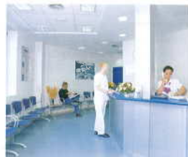
Nuevo edificio Consultas Externas.

Hospital Clínica Roca, único de carácter privado en el sur de Gran Canaria, ofrece a todos los residentes de la zona la comodidad de poder contar con unos servicios asistenciales de la máxima calidad cerca de su hogar, recibiendo el trato humano y cordial que se merecen.