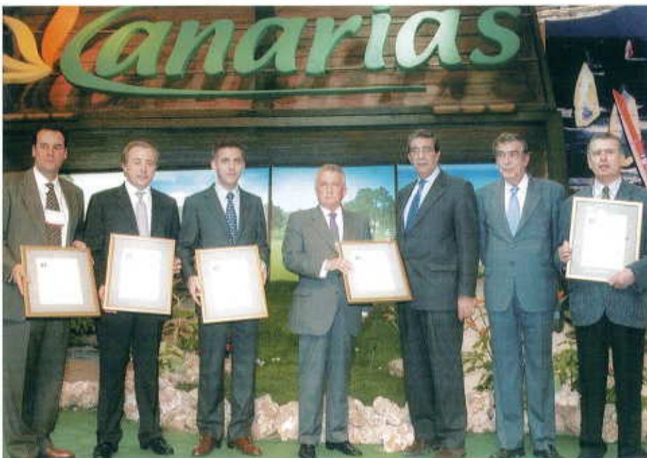
Entrega del Certificado Calidad ISO 9002 en FITUR

Resaltar que actualmente se está trabajando en la adaptación de nuestro Sistema de Aseguramiento de la Calidad a la Norma ISO 9001:2000 e igualmente en la elaboración de la documentación para la implantación de la Norma ISO 14000, así como para llevar a cabo la implantación de todo el Sistema de Calidad en los hospitales de reciente incorporación, como es el caso de Hospiten Santo Domingo y Hospital Clínica Roca durante el año 2002.